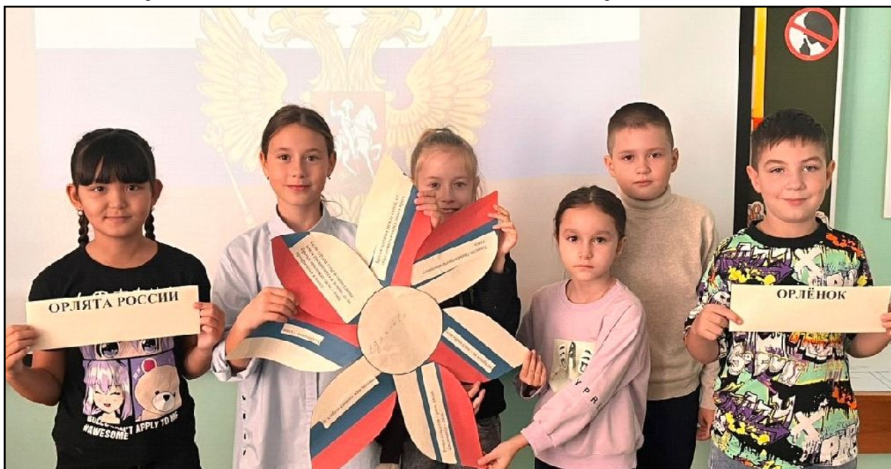
По информации МОУ "СОШ МО пос. Михайловский"

Ребята 1-4 классов приняли участие в увлекательной интерактивной викторине, исполнили гимн России, обсудили символы нашей страны и выделили ключевые моменты, объединяющие всех россиян.