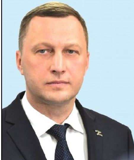
Регион 64. Информационное агентство