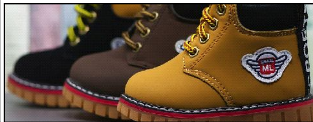
Регион 64. Информационное агентство

На 112% выросло обеспечение жильем детей-сирот. Поддержку в этом направлении оказывает председатель Государственной думы Вячеслав Володин, который ежегодно привлекает дополнительные средства.