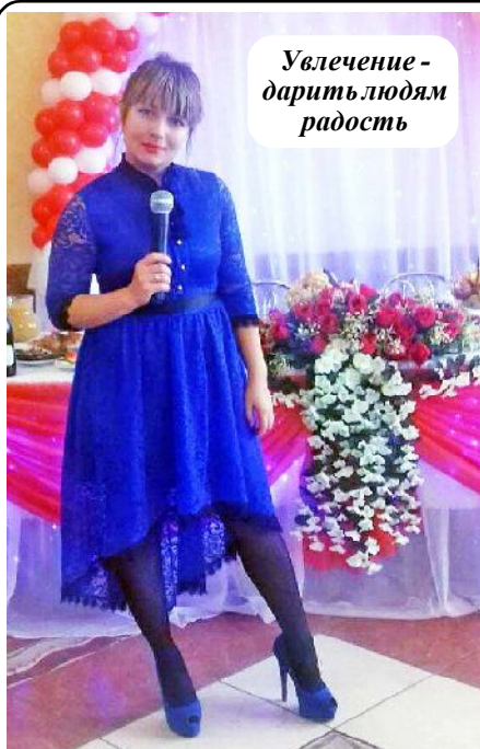
Увлечение - дарить людям радость