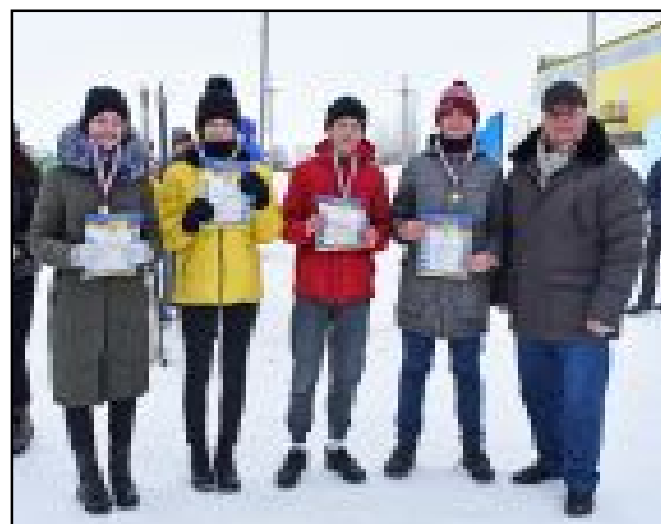
Победителем эстафеты стала сборная п. Петровский и п. Горный