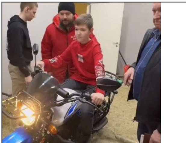
Регион 64. Информационное агентство

«Я накопил потихоньку, и мы с дедушкой решили сделать такой подарок бойцам на Новый год», - заявил школьник. Совсем скоро «Народный фронт» передаст мотоцикл «за ленточку».