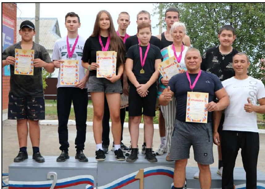
Спортивные мероприятия продолжаются...

и призеры награждены грамотами и медалями. Силовые виды спорта с каждым годом набирают все большую популярность у наших ребят. На спортивной школе созданы все условия для поддержания хорошей формы юных спортсменов: в тренажерном зале имеется необходимое оборудование, которым могут бесплатно пользоваться все желающие.