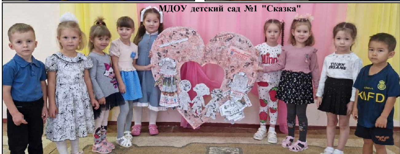
МДОУ детский сад №1 "Сказка"