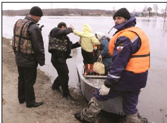
Регион 64. Информационное агентство

Координация соответствующих мероприятий возложена на комиссию по предупреждению и ликвидации ЧС и обеспечению пожарной безопасности при правительстве региона.