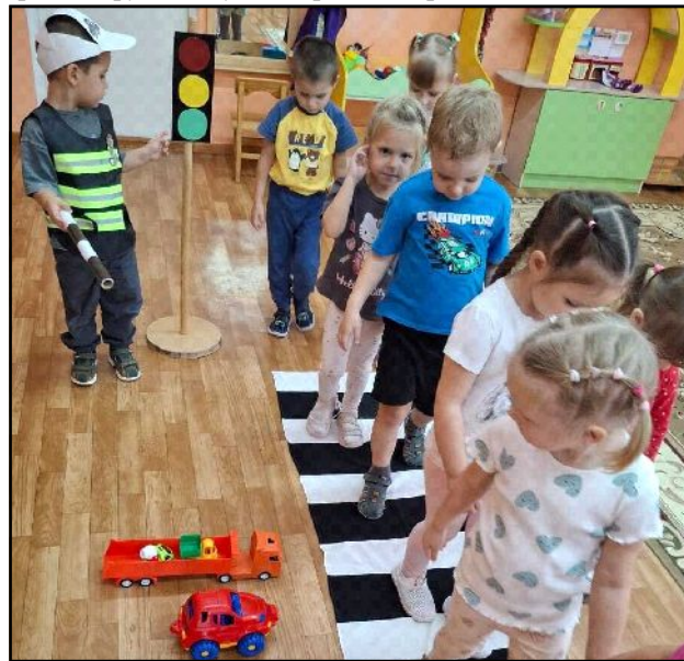
МДОУ д/с №1 "Сказка"

В детском саду "Сказка" с детьми подготовительной группы провели игру "Вызови пожарных". С детьми средней группы выучили правила дорожного движения.