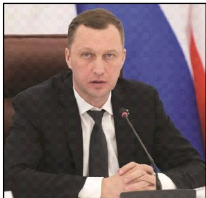
Глава региона провел заседание организационного комитета «Победа», на котором обсуждалось проведение мероприятий, приуроченных к 9 Мая.

Представители совета ветеранов выступили с предложением отменить салют. Сэкономленные средства будут направлены на помощь участникам специальной военной операции. Глава региона и члены комитета поддержали инициативу. Также принято решение не проводить торжественное прохождение войск Саратовского гарнизона, так как подразделения выполняют боевые задачи.